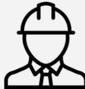
Montage vor Ort